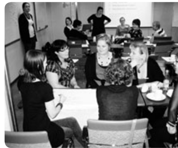
Suomen Monikkoperheet ry:n alueyhdistysten hallitusaktiivit järjestökoulutusristeilyllä syyskuussa 2011.